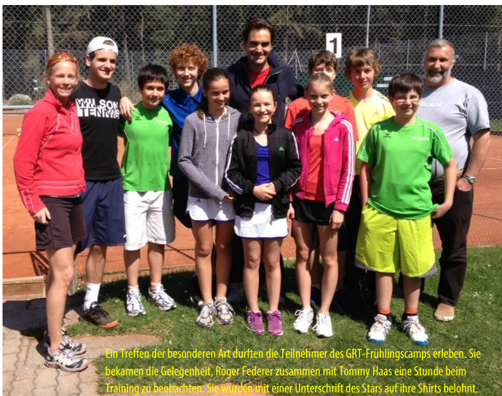
Ein Treffen der besonderen Art durften die Teilnehmer des GRT-Frühlingscamps erleben. Sie bekamen die Gelegenheit, Roger Federer zusammen mit Tommy Haas eine Stunde beim Training zu beobachten. Sie wurden mit einer Unterschrift des Stars auf ihre Shirts belohnt.